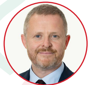
Jeremy Miles AS

Mae'r defnydd o'r sylfaen dystiolaeth ymchwil ym maes iechyd a gofal cymdeithasol yn parhau i fod mor hanfodol ag erioed, ac fel yr Ysgrifennydd Cabinet sydd newydd ei benodi ar gyfer y portffolio hwn, rwyf am bwysleisio pwysigrwydd Ymchwil a Datblygu wrth wella canlyniadau gofal iechyd, ac edrychaf ymlaen at weithio gyda'n cymuned ymchwil yng Nghymru i fanteisio ar gyfleoedd ac ategu'r hyn yr ydym wedi'i ddysgu hyd yn hyn, gan ddod â buddion ymchwil i bawb.